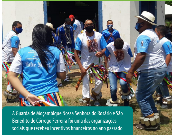
A Guarda de Moçambique Nossa Senhora do Rosário e São Benedito de Córrego Ferreira foi uma das organizações sociais que recebeu incentivos financeiros no ano passado