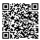
Contenção finalizada da Barragem B3/B4