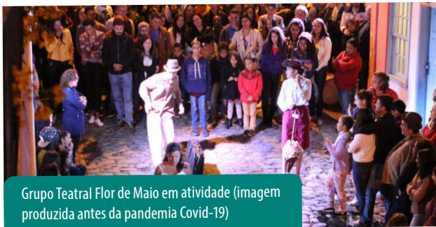
Grupo Teatral Flor de Maio em atividade (imagem produzida antes da pandemia Covid-19)

Transformar talento em oportunidades de trabalho e geração de renda é a intenção do Projeto Desenvolvimento Territorial e Transformação Social que, em parceria com a Vale, realiza capacitações voltadas para empreendedores da economia criativa, agroecologia e turismo, além do fortalecimento institucional a 14 associações e coletivos que atuam em Itabirito.