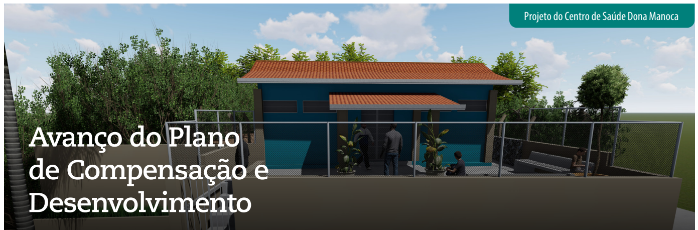
Projeto do Centro de Saúde Dona Manoca

Queremos conhecer você e ouvir a sua opinião para melhorar o Vale Notícias . Aponte a câmera do seu celular para a figura ao lado (QR Code) e dê a sua contribuição.