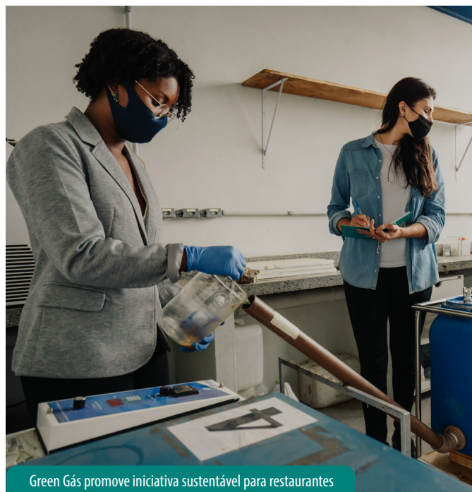
Green Gás promove iniciativa sustentável para restaurantes

Com a participação de 311 empreendedores na fase de pré-aceleração (dos quais 89 são de Itabirito), o projeto incentiva a abertura de novos negócios e a transição daqueles preexistentes para a lógica de negócios de impacto, isto é, que deixam marcas sociais e ambientais positivas, além de gerar lucro. São 79 projetos em fase de pré-aceleração, cujos empreendedores foram capacitados, e 39 selecionados para a fase de aceleração (dos quais 10 são de Itabirito), quando receberão mentorias individuais e recursos financeiros para investir e desenvolver suas atividades.