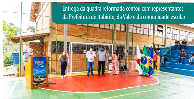
Entrega da quadra reformada contou com representantes da Prefeitura de Itabirito, da Vale e da comunidade escolar