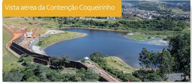
Vista aérea da Contenção Coqueirinho

Os diques 3 e 4, da barragem do Pontal, também serão eliminados. As atividades fazem parte do Programa de Descaracterização, que prevê que todas as estruturas alteadas sobre o rejeito sejam eliminadas, seguindo o compromisso da empresa e por exigência legal. A previsão de conclusão de todas as atividades de descaracterização no sistema Pontal é em dezembro de 2022.