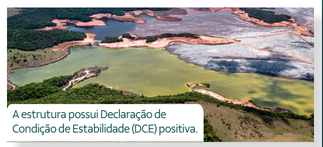
A estrutura possui Declaração de Condição de Estabilidade (DCE) positiva.

Até julho, cerca de 240 trabalhadores atuarão na limpeza de uma camada de solo implantada sobre o aterro de alteamento.