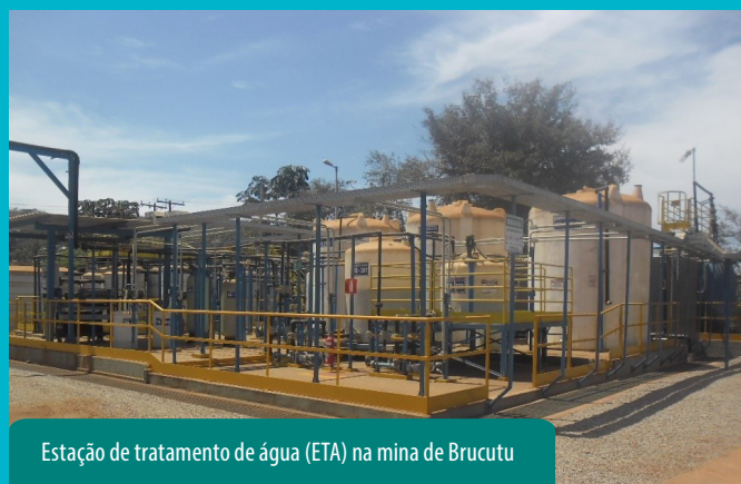
Estação de tratamento de água (ETA) na mina de Brucutu

Nossas medidas de controle são feitas por meio de estações de tratamento/clarificação de água e efluentes, recuperação de áreas, revegetação, preservação de nascentes, limpeza e criação/manutenção de diques para contenção de sedimentos, entre outras iniciativas.