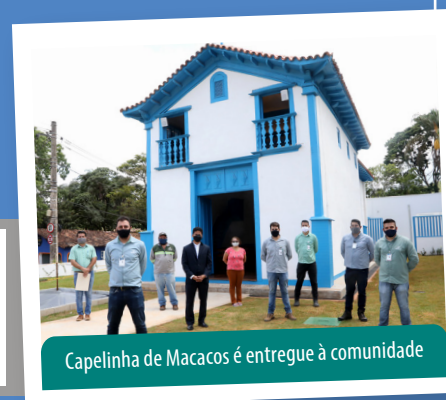
Capelinha de Macacos é entregue à comunidade