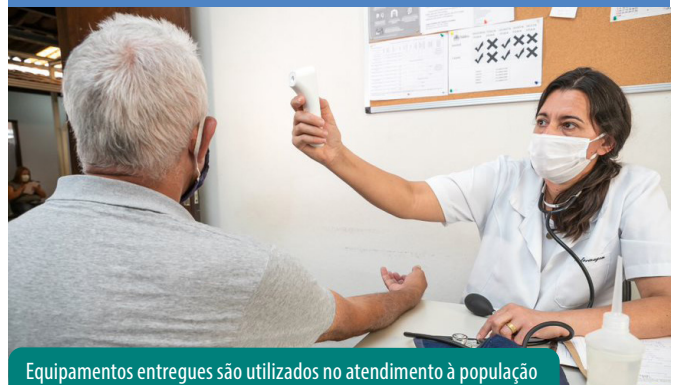
Equipamentos entregues são utilizados no atendimento à população

Para ajudar no combate à pandemia do novo coronavírus, a Vale doou uma ambulância ao município, três foram reformadas e outras quatro estão em manutenção.