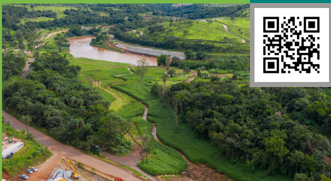
O Marco Zero é a primeira área impactada recuperada, que reconstituiu o traçado original de um trecho da calha do ribeirão Ferro-Carvão até o encontro do Rio Paraopeba

Vinte e cinco de janeiro de 2019 sempre será lembrado como o dia mais triste da nossa história. Assumimos o compromisso de honrar cada vítima dessa tragédia transformando a Vale numa empresa mais humana, segura e sustentável. Atualmente, mais de 6.500 pessoas atuam para transformar vidas e reparar os territórios impactados pelo rompimento da Barragem B1, em Brumadinho. Veja o que temos feito pelas pessoas e pelo meio ambiente.