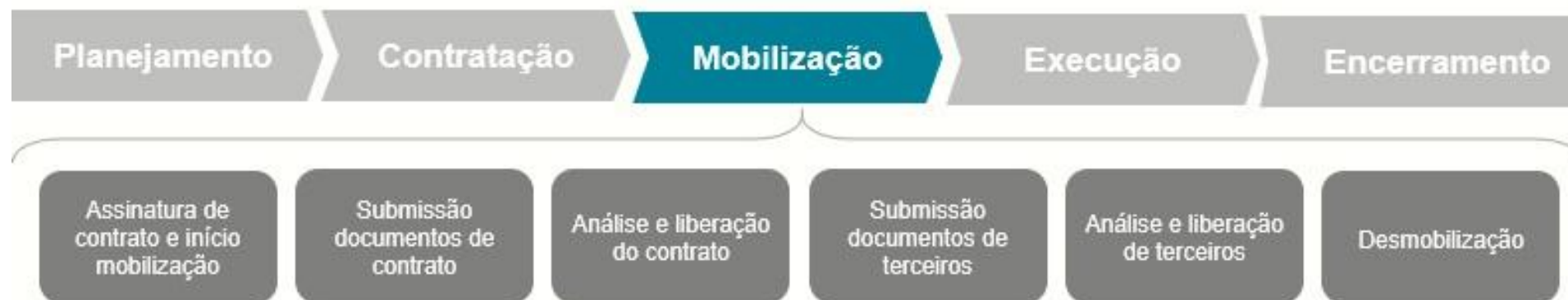
Figura 1 – Macrofluxo da mobilização de contratos e terceiros Vale

Segue abaixo o macro fluxo do processo de gestão de contratos com abertura do macro processo de mobilização documental.