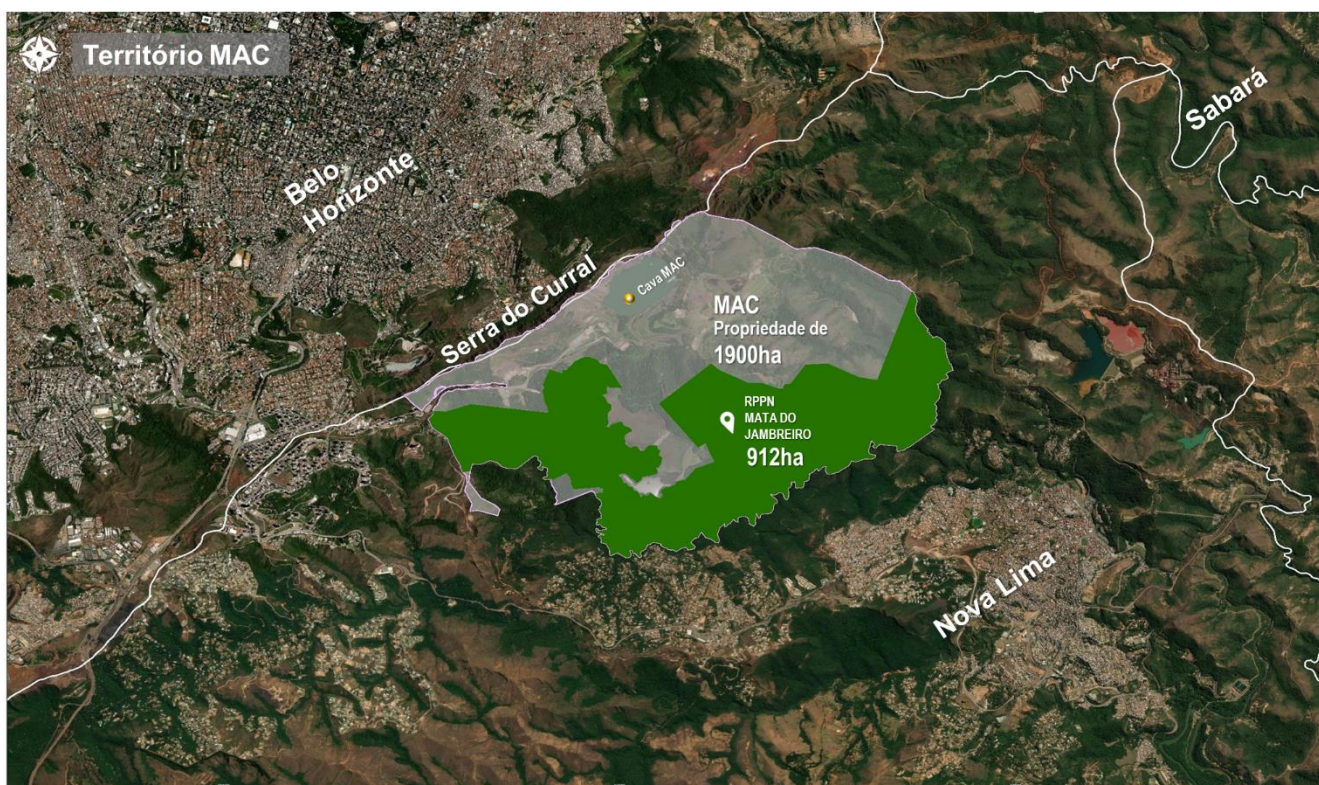
Figura 1 - Localização Mina de Águas Claras.

A mina localiza-se no município de Nova Lima, no flanco sudeste da Serra do Curral - Patrimônio Cultural de Belo Horizonte, e é um dos símbolos da capital mineira. Sua localização estratégica possui múltiplos interesses e uma importância histórica, cultural e social. A MAC compreende uma área total 1.908ha, de propriedade da Vale S/A, na qual há 912hectares de área protegida privada denominada RPPN Mata do Jambreiro.