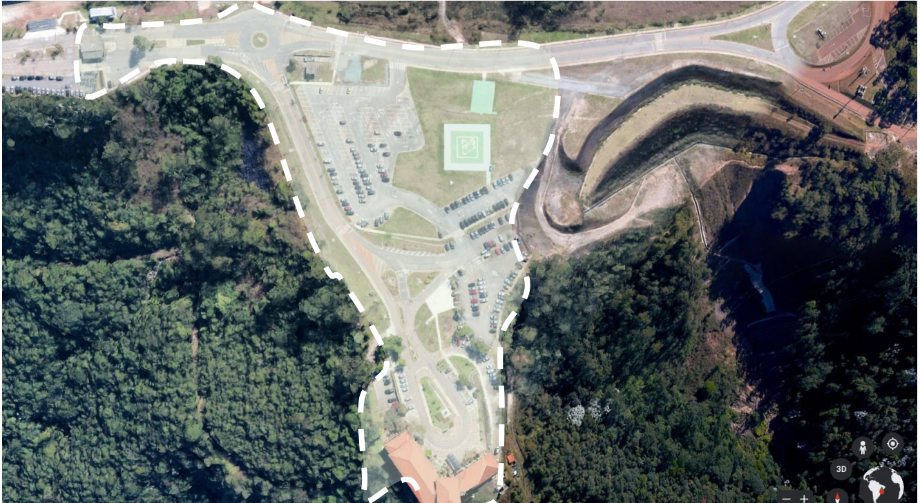
Figura 3 - Localização do Setor 1 da Mina de Águas Claras

Neste sentido, a Vale S/A em busca de soluções sustentáveis que gerem negócios positivos para a sociedade disponibilizará parte do território da MAC para que empresas dos setores de lazer, entretenimento, e esporte desenvolvam projetos em quatro categorias: shows e eventos, ativações esportivas, cultura local e projetos ambientais.