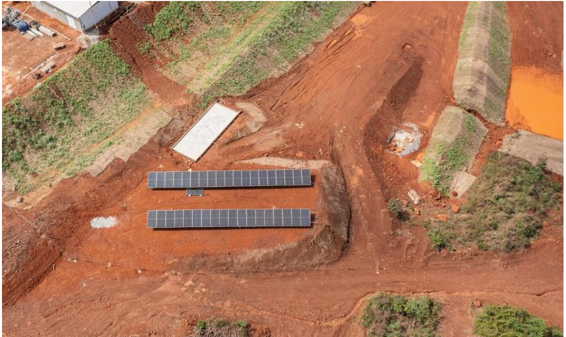
Figura 3 - Barragem Campo Grande: Instalação de placas solares para canteiro (26/10/2022)