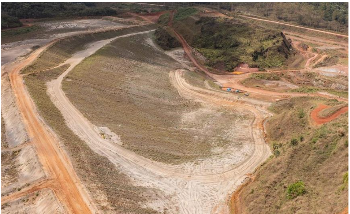
Figura 4 - Barragem Campo Grande: Investigações geotécnicas para projeto detalhado (26/10/2022)