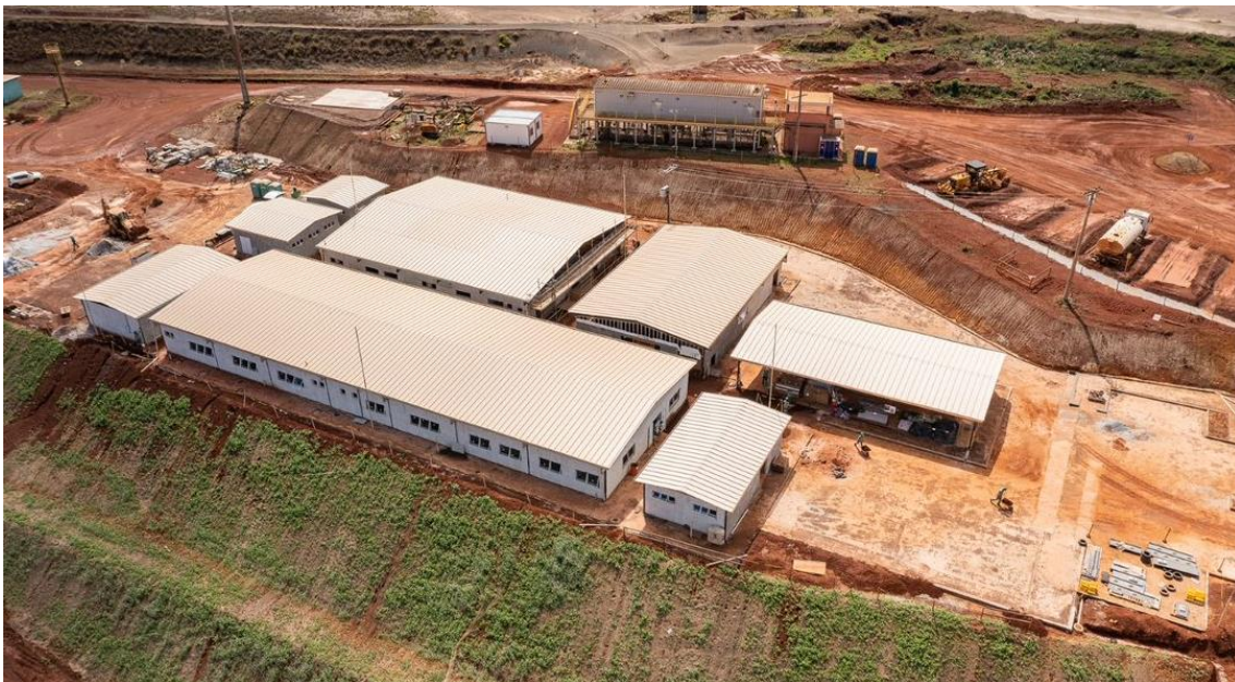
Figura 2 - Barragem Campo Grande: Construção de canteiro de obras (26/10/2022)