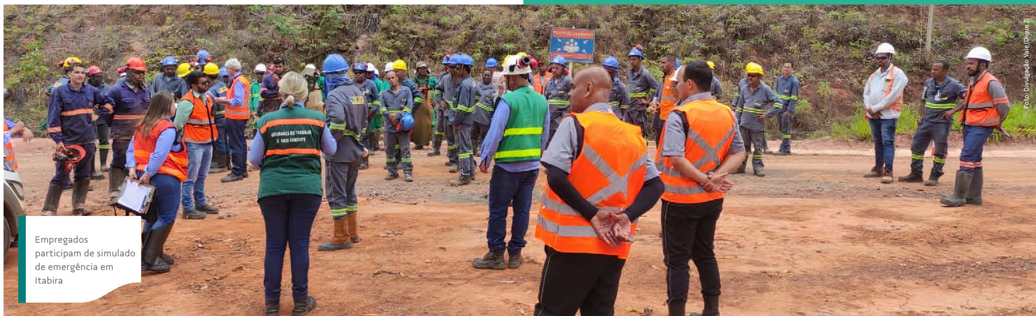
Empregados participam de simulado de emergência em Itabira