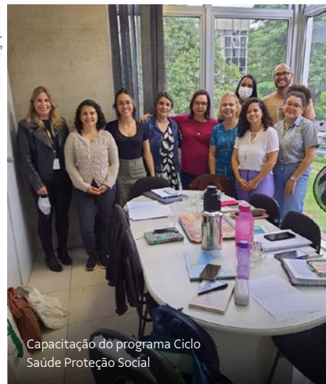
Capacitação do programa Ciclo Saúde Proteção Social

O Ciclo Saúde Proteção Social é uma iniciativa da Fundação Vale, em parceria com a Secretaria Municipal de Saúde de Itabira e com o Centro de Promoção da Saúde (Cedaps).