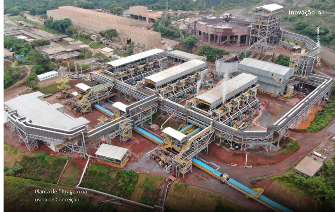
Planta de filtragem na usina de Conceição