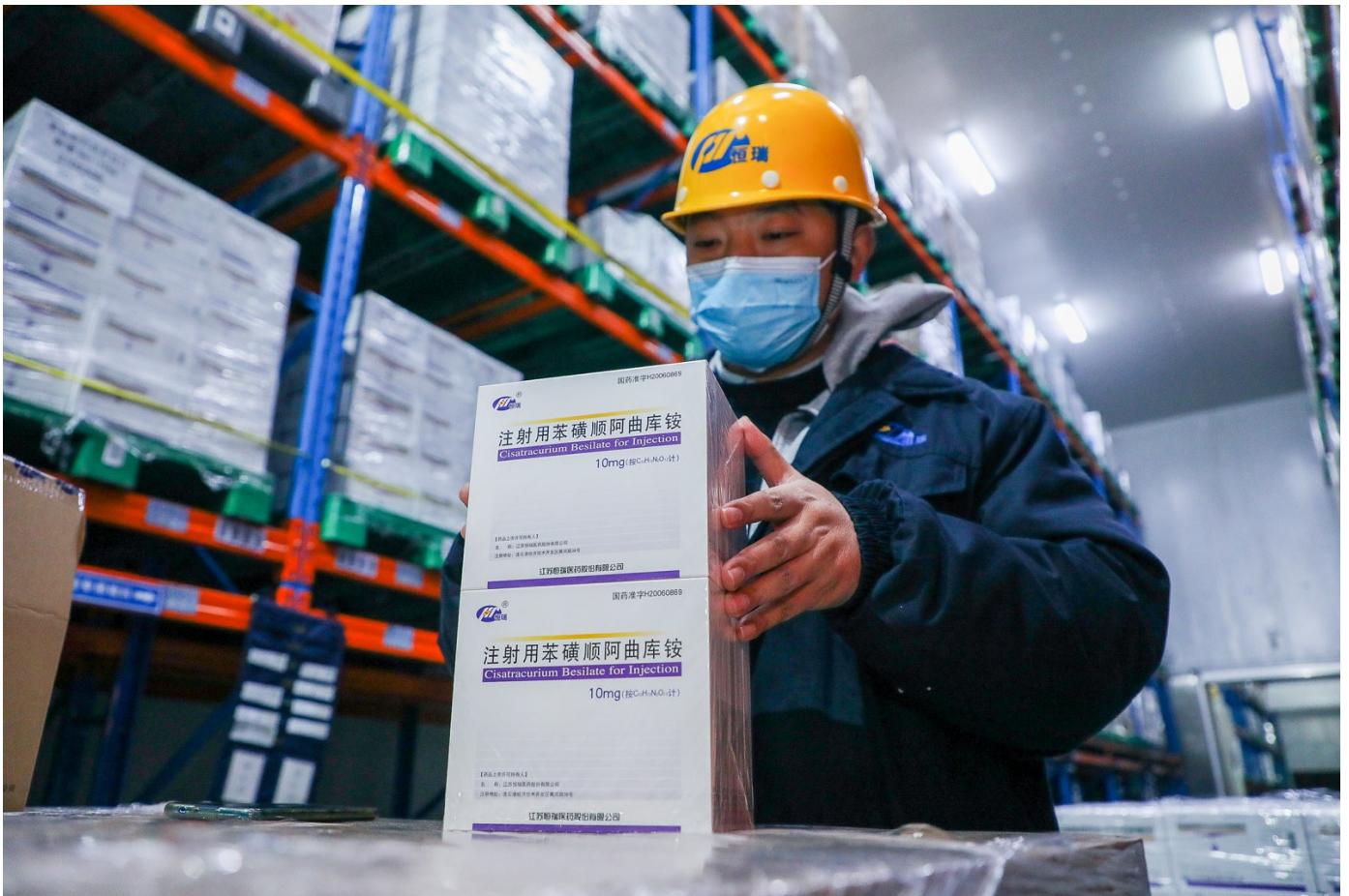
Fabricação dos medicamentos para intubação em Lianyungang, China