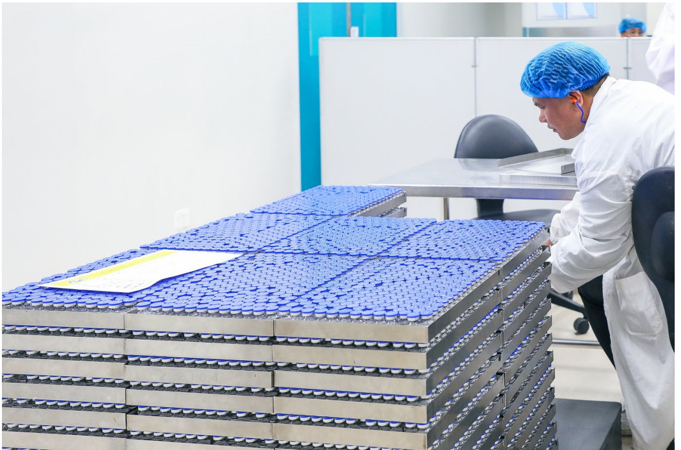
Fabricação dos medicamentos para intubação em Lianyungang, China