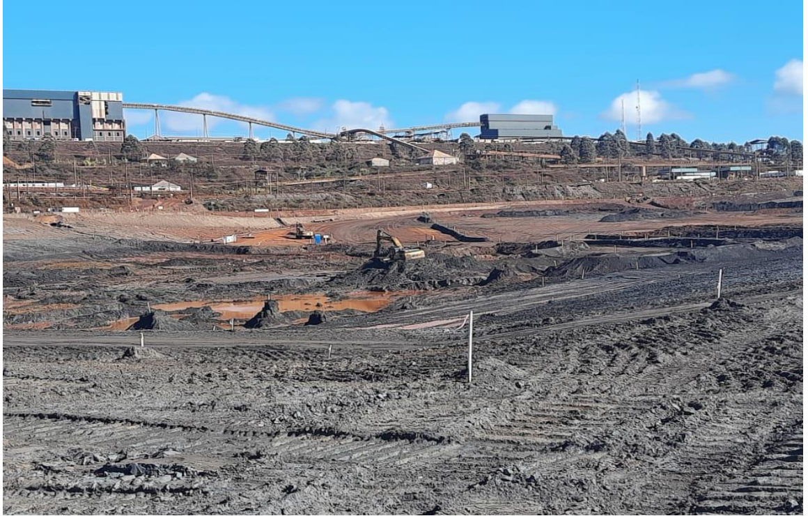
Figura 4 – Marcações topográficas do off set final do projeto (25/07/2022)