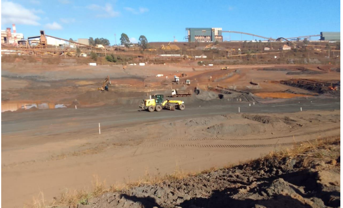
Figura 2 – Visão Geral da escavação Área 1 Fase 2(25/07/2022)