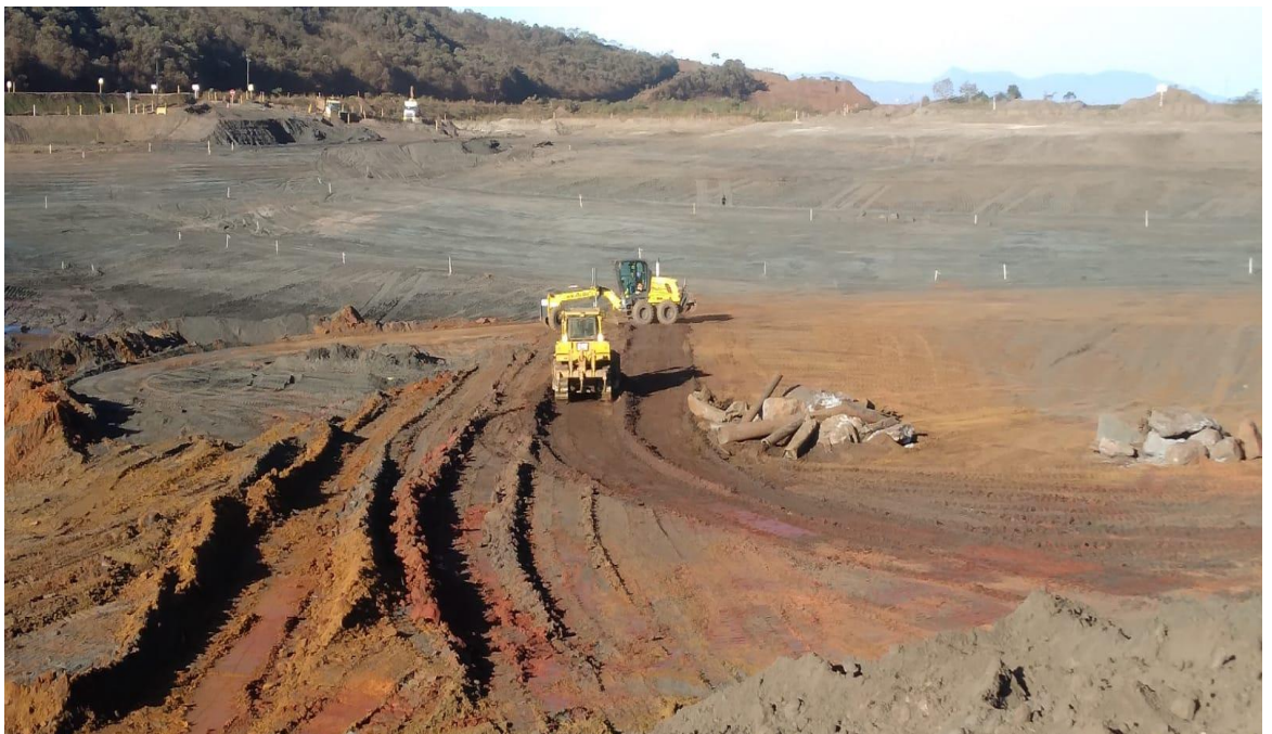
Figura 3 – Execução dos lastros para acesso ao reservatório (25/07/2022)