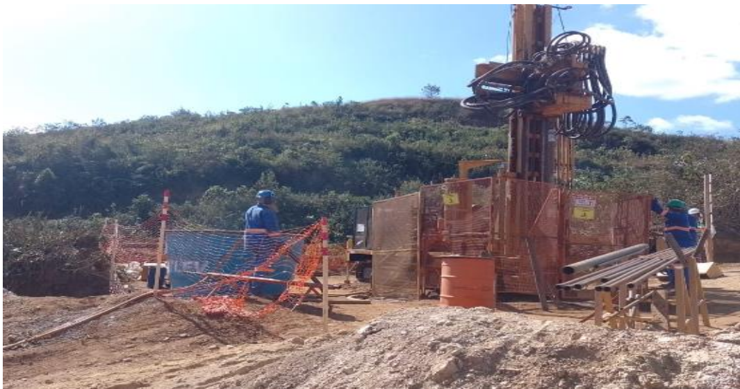
Figura 4 - Barragem Campo Grande: Investigações geotécnicas para projeto detalhado (22/07/2022)