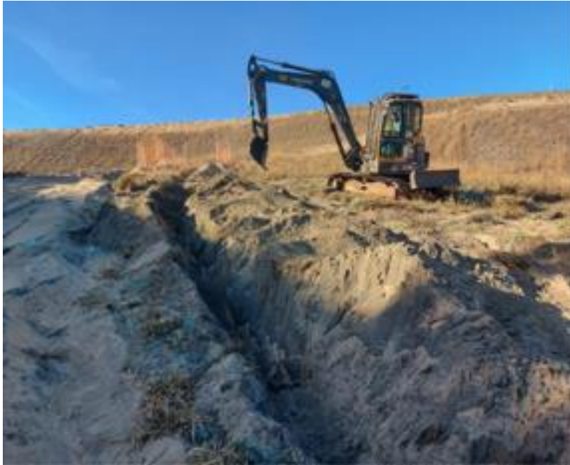
Figura 5 - Barragem Campo Grande: Instalação rede microssísmica (22/07/2022)