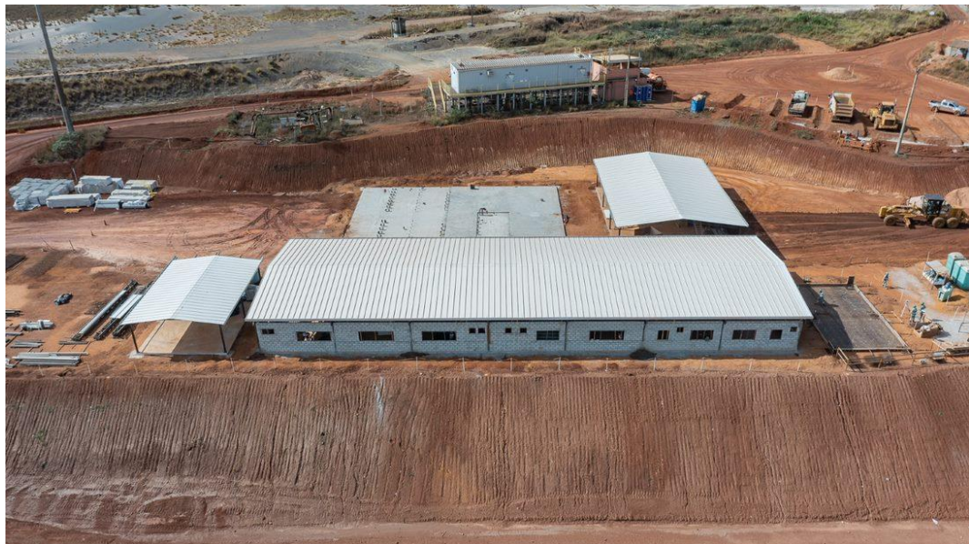
Figura 2 - Barragem Campo Grande: Construção de canteiro de obras (22/07/2022)