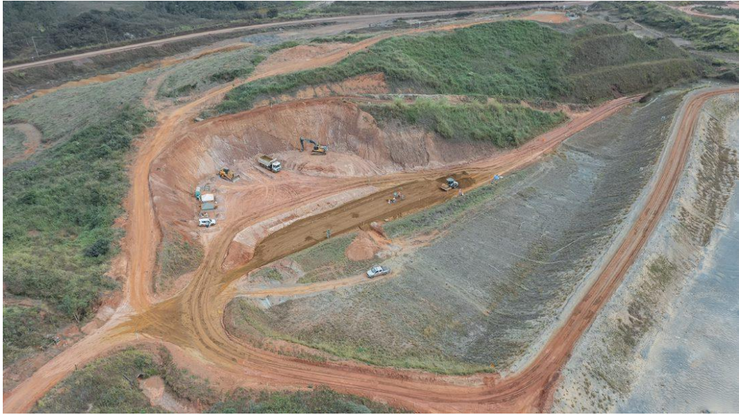
Figura 3 - Barragem Campo Grande: Aterro experimental (22/07/2022)