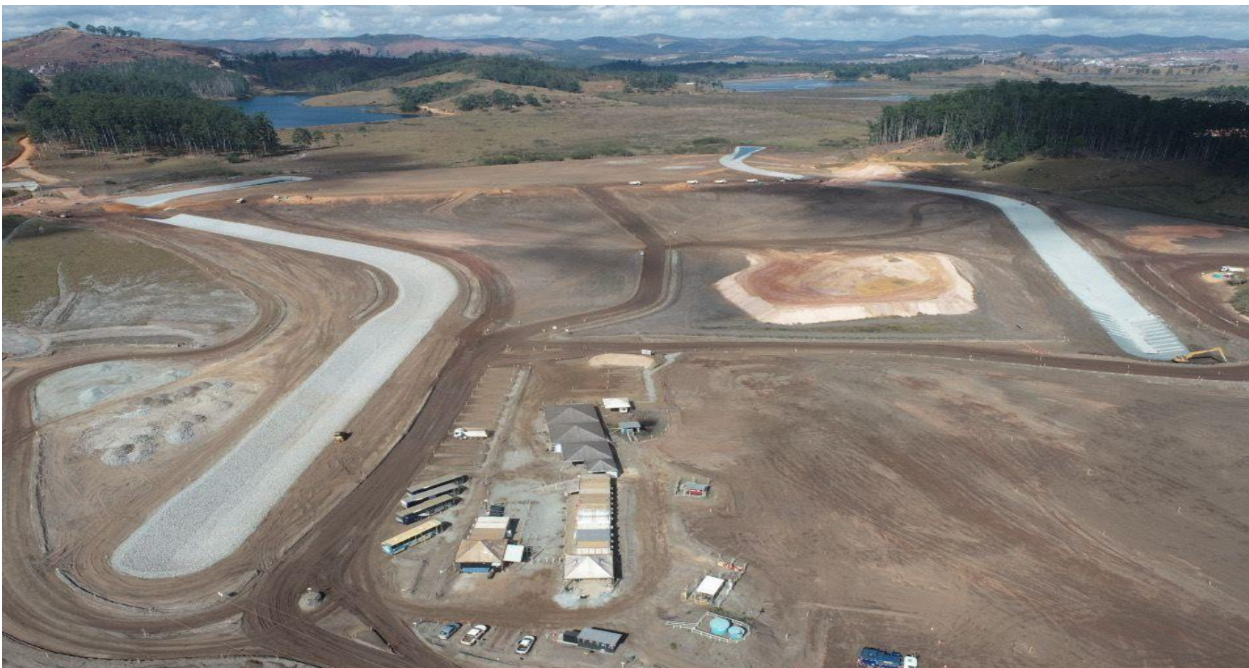
Figura 3 – Vista de Montante para Jusante do Antigo Barramento do Dique 4. Data de corte: julho/2022.