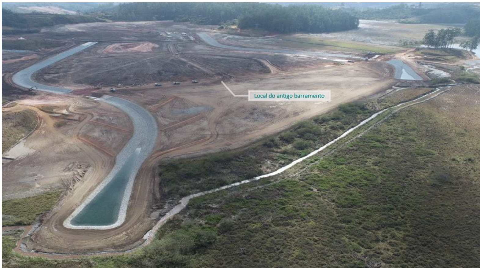
Figura 2 – Vista de Jusante para Montante do Antigo Barramento do Dique 4. Data de corte: julho/2022.