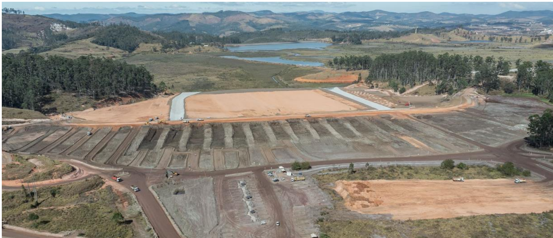
Figura 2 – Vista de Montante para jusante. Data de corte: julho/2022.