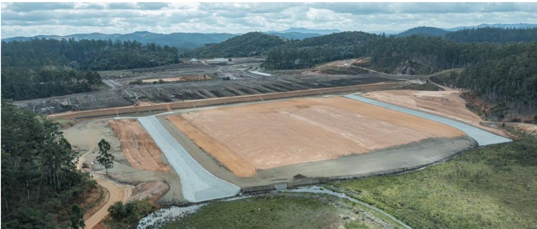
Figura 3 – Vista de Jusante para montante. Data de corte: julho/2022.