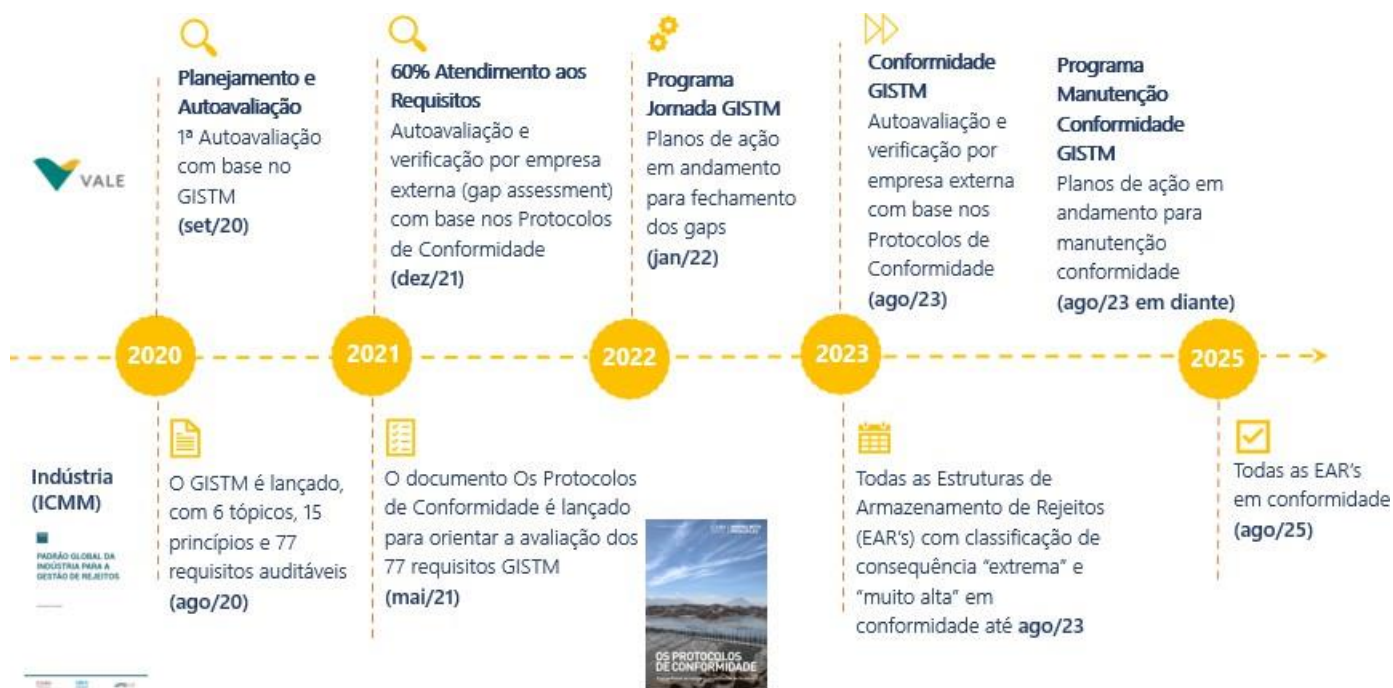
Figura 1 – Linha do tempo das principais ações de implementação do GISTM na Vale

A Figura 1 mostra as principais ações de implementação do GISTM na linha do tempo.